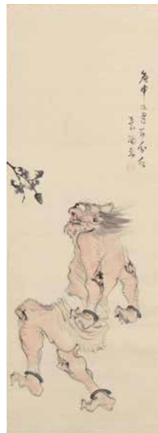
【図2】 「鬼図」 やまぐちそけん 山口素絢筆 江戸時代・寛政12年(1800)

中央に座っている人物は、中国・唐時代の武将の郭子儀。子孫たちがみな出世し、本人も長生きしたため、おめでたい画題として好まれました。