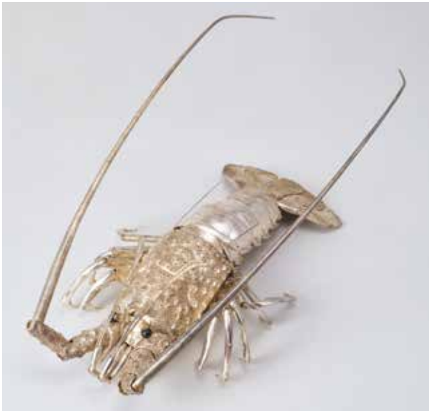
【図16】 「伊勢海老自在置物」 高瀬好山製 明治～昭和時代初期・19世紀

みずみずしい茄子や枝付きの柿、無花果、仏手柑、蜜柑は、象牙を彫って彩色をほどこしたものです。本物と見まがうばかりの質感です。