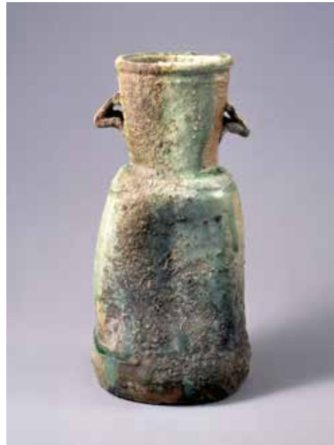
〔図11〕* い が みつきはなれ めいなりひら 「伊賀耳付花入 銘業平」 桃山時代・16~17世紀 へこみやゆがみのあるユニークな形をした花瓶。豪快で自由な桃山時代の気風が伝わってくるようです。