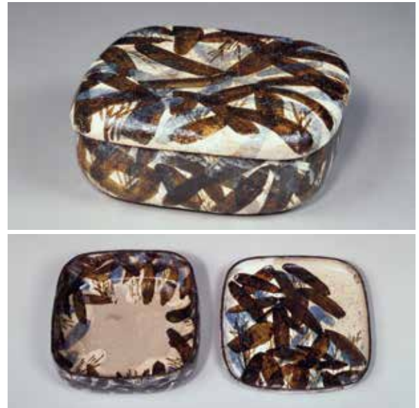
【図17】* 「鏝絵染付笹図蓋物」 尾形乾山作 江戸時代・18世紀

銀製の伊勢海老は、触角を前後に振ったり、脚を関節で曲げることができ、腹部も伸ばしたり、内側に折り曲げたりできます。昆虫や動物を、形姿だけでなく、胴や関節などが動く機能まで実物と同じように作った自在置物です。