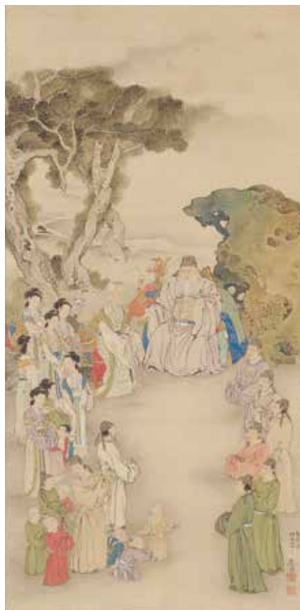
【図1】* 「郭子儀祝賀図」 まるやまおきよ 円山応挙筆 江戸時代・安永4年(1775)

満開の桜のもと、天狗の面をかぶり、扇を手に酒の樽を背負った男性と、串団子をくわえた女性が酔いにまかせて踊っています。