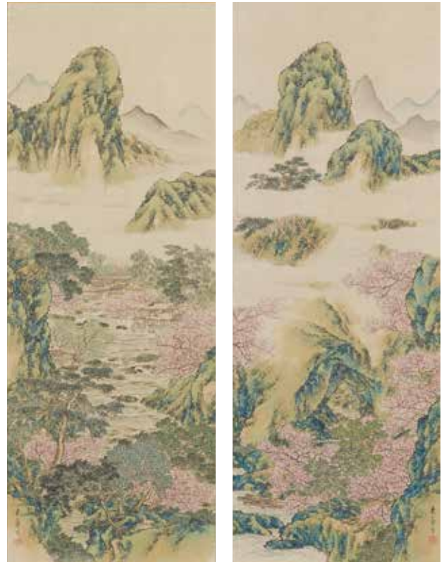
〔図9〕 「武陵桃源図」 中島来章筆 江戸時代・19世紀

一重咲、八重咲など種類や大きさの異なる様々な菊の花を、天板のみならず、裏面や脚にまでびっしりと描き込んだ蔴絵の高坏(食物を盛る脚付きの台)。花びらの一部には、虹色に輝く螺鈿も用いられています。