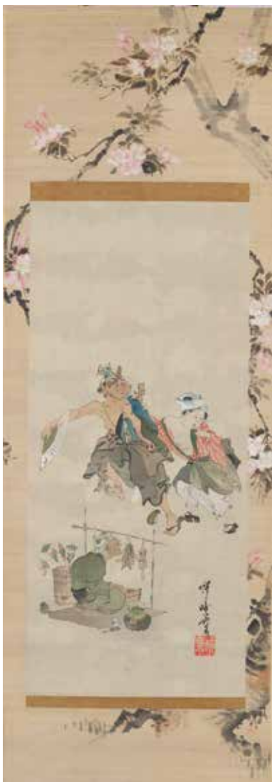
【図3】* 「花見の図」 かわなべきょうさい 河鍋暁斎筆 江戸時代・19世紀

絵画に描かれた人物や動物がどこので、どんなシチュエーションに置かれているのかをがかりに、その人物や動物の感情を感じ取ってみましょう。また能面に彫り表された顔の表情から、それぞれの心情に思いをはせてみましょう。