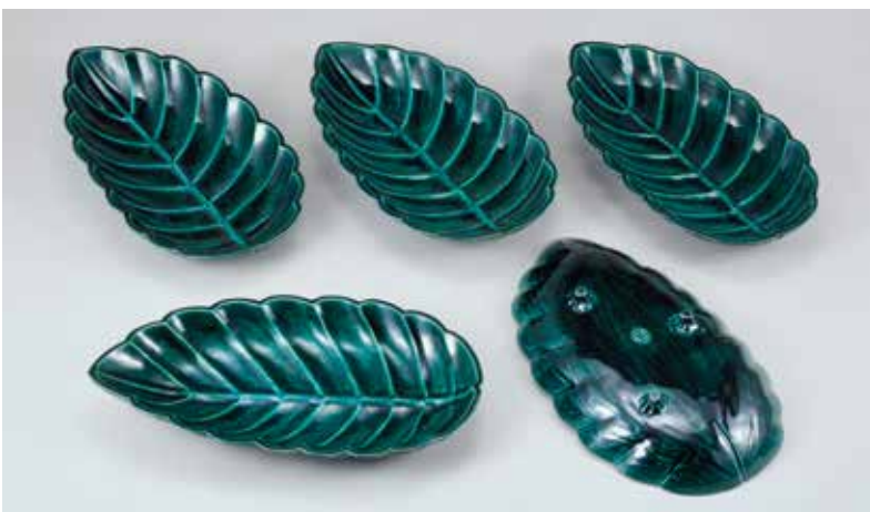
【図18】 「萌黄交趾釉柏葉皿」 永樂保全作 江戸時代・天保14年～弘化4年頃(1843~47頃)

丸みをおびた正方形に近い形の蓋付きの容器。器の表面はもちろん、蓋裏や見込にいたるまで、雪中の笹がダイナミックに描かれています。