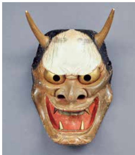
【図4】* 重要文化財 「能面 蛇」 室町時代・14~16世紀

鬼が目玉も飛び出るほどに驚いているのは、節分に家の入口などに飾り邪気を払う焼嗅のせいでしょう。ひいらぎの枝にイワシの頭を刺したもので、鬼の目突き、鬼おとしなどと呼ばれました。