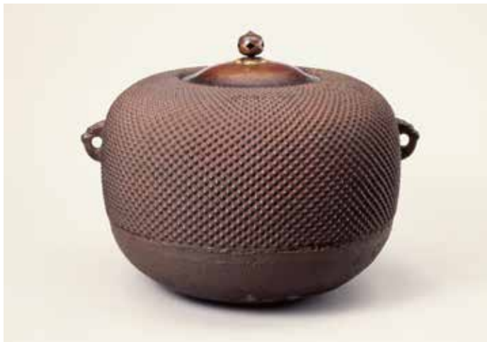
〔図12〕* らばぐちあられがま よ じろう 「姥口霰釜」 与次郎作 桃山時代・16世紀

美術館では実際に作品に触れることはかありませんが、金属や焼きもの、木といった素材ごとの特性に加え、表面の状態を観察することで触った感触を想像してみてください。