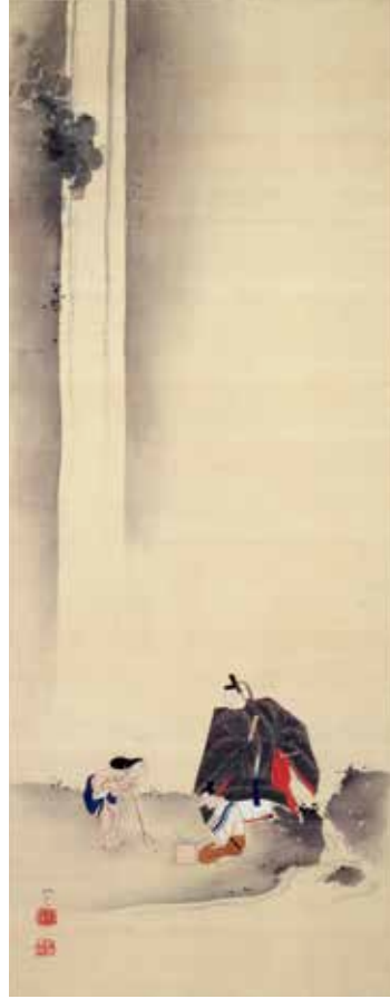
【図6】 「養老勅使図」 田中訥言筆

波の打ち寄せる岩場に松と丹頂鶴が描かれ、背景にほんのりと引かれた赤色が朝日を連想させます。親子の鶴が鳴き声を交わしています。