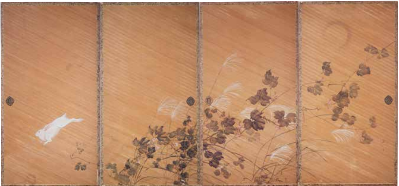
【図7】* 「秋草に兔図」 酒井抱一筆 江戸時代・19世紀

頭上から勢いよく流れ落ちる養老の滝と三人の人物を描いています。薬になる水がわき出たことを聞いた勅使(天皇の使者)が、それを発見した息子と老父に経緯を尋ねている場面です。