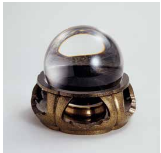
〔図13〕 すいしょうだま ひらめ じすいしょうだい ざらひこ 「水晶玉・平目地水晶台」 象彦(西村彦兵衛)製 明治~昭和時代初期・19~20世紀

三井家が所蔵する水晶玉のうち、最も大きい直径六寸(約18cm)、重さ二貫三百匁(約8.9kg)の水晶玉と、それを飾るための蒔絵の台です。