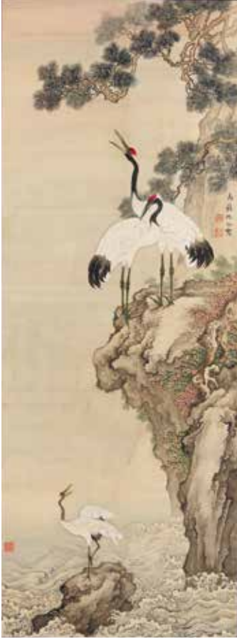
【図5】* 「花鳥動物図(松樹双鶴図)」 沈南蘋筆 清時代・18世紀

身近な動物や鳥、虫たちの鳴き声、活気にあふれる人々の喧騒、風や雨の音など、 絵画や工芸品の中からきこえてくる様々な音色に耳を傾けてみましょう。