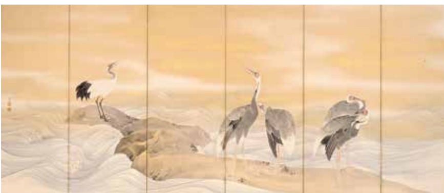
〔図10〕 「海辺群鶴図屏風」 三井高福筆 明治18年(1885)

北三井家八代・高福が海辺で憩う鶴の群れを描いた屏風。円山応挙の図を手本に写したもので、右隻に丹頂鶴、左隻に真鶴と丹頂が描かれています。